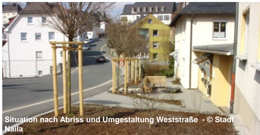
Situation nach Abriss und Umgestaltung Weststraße